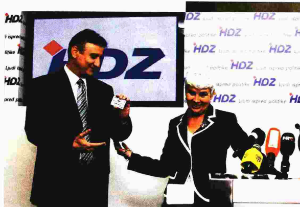
JADRANKA KOSOR PRVA JE HRVATSKA PREMIJERKA, A OSTAT ĆE ZAPAMĆENA JER JE POTPISALA PRISTUPNI UGOVOR O ULASKU HRVATSKE U EU (NA MANJOJ SLICI URUČUJE ISKAZNICU HDZ-A TOMISLAV KARAMARKU)